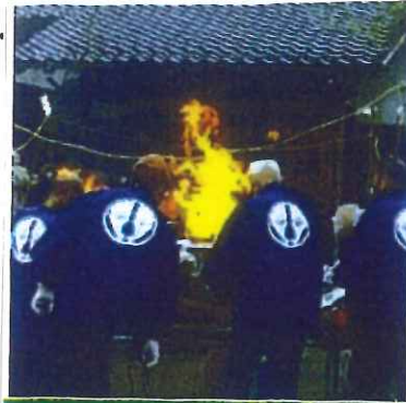
寺子屋サロンの店も出店します!